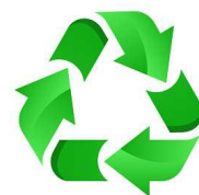
GUIDE POUR CHOISIR LE REMPLISSAGE

Le produit est 100% recyclable par notre propre entreprise qui, avec un traitement évident en autorisation ordinaire, transformera à nouveau le granulé en fin de vie en une nouvelle matière première secondaire, le régénérant pour de nouveaux terrains de football synthétiques.